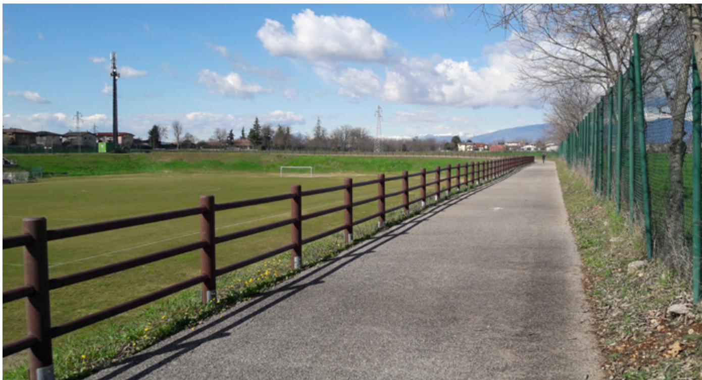
Vista nuovo steccato impianti sportivi di Caselle

Gli interventi summenzionati contribuiscono a rendere visibile e concreta l'importanza della raccolta differenziata effettuata da tutti noi. Le strutture in plastica riciclata derivano, infatti, dal processo di trattamento di diversi tipi di plastica insieme, detta plastica riciclata eterogenea , impiegata anche per la produzione di panchine, parchi giochi, recinzioni, arredi per la città, cartellonistica stradale.