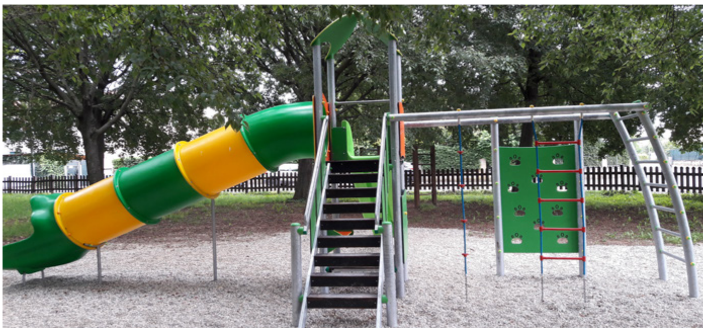
Nuovo gioco al parco di via Don Tramonte

Arredo urbano. In tema di arredo urbano, si prosegue con la graduale sostituzione dei giochi con struttura lignea, adottati fino a qualche anno fa, giunti ormai a “fine vita” in seguito al deperimento del materiale naturale, sostituendoli con altri che prevedono l'impiego di strutture portanti in acciaio con pannellature in materiale plastico riciclato e scivoli in polipropilene. In questi giorni è stato installato una nuova composizione di gioco presso il parco di via Don Tramonte, e nei prossimi mesi anche nei parchi di via Pindemonte, via del Lavoro e nel parco dei Fanti a Custoza.