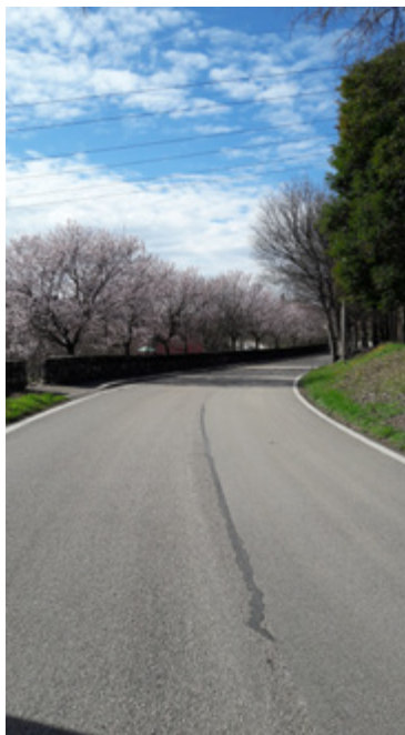
Sigillatura di via Strada Nuova