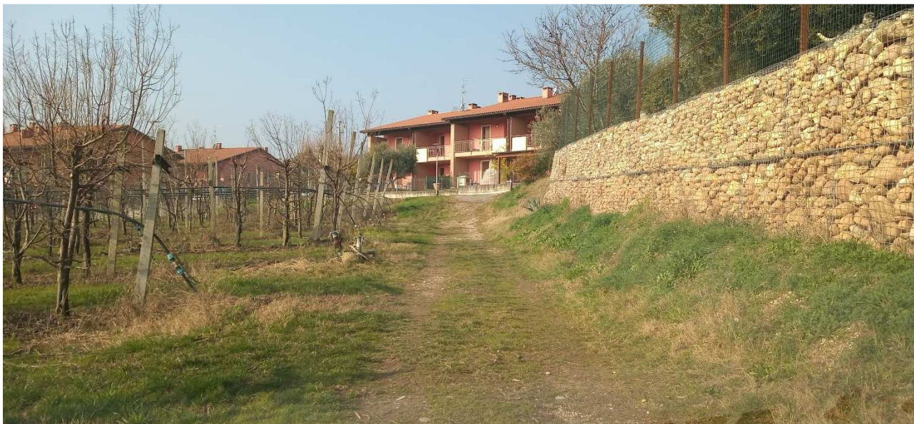
FOTO INSERIMENTO DELLO STATO DI PROGETTO DELLA PISTA CICLABILE SUL SEDIME DELLA STRADA COMUNALE PODERALE “NOGAROLA”