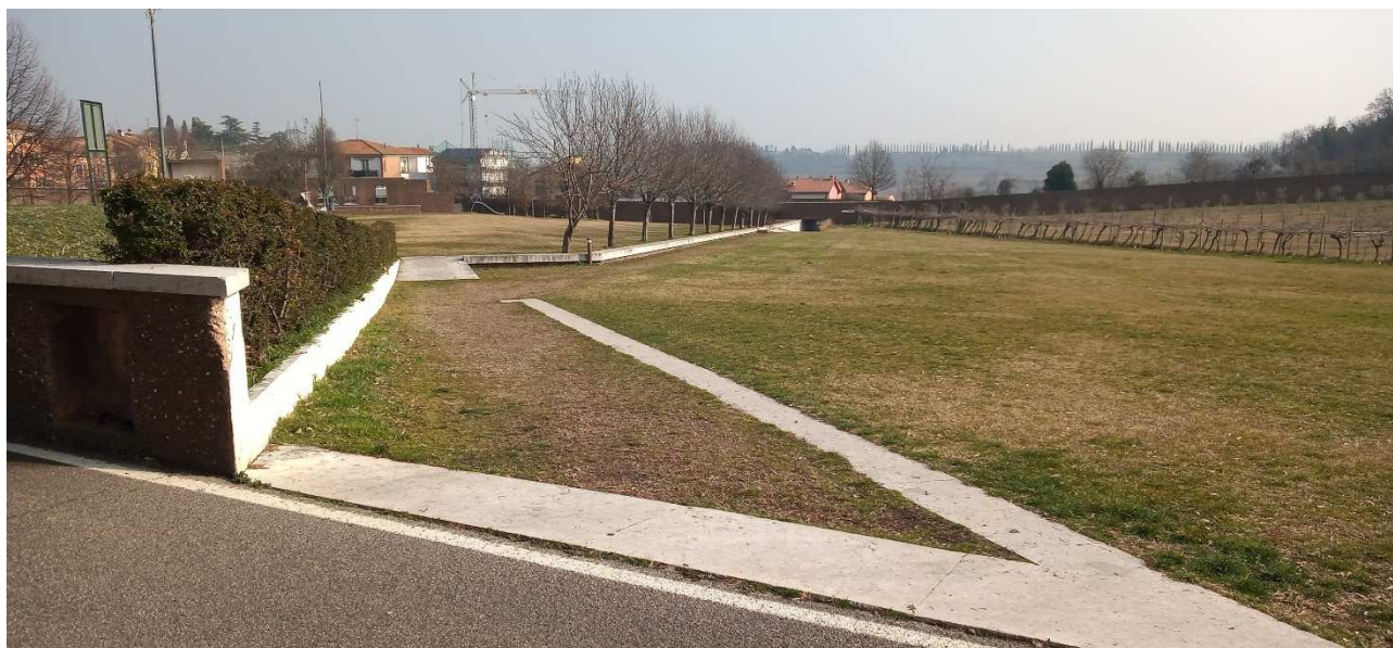
FOTO INSERIMENTO DELLO STATO DI PROGETTO DEL PERCORSO CICLO PEDONALE NEL PARCO URBANO DI CUSTOZA