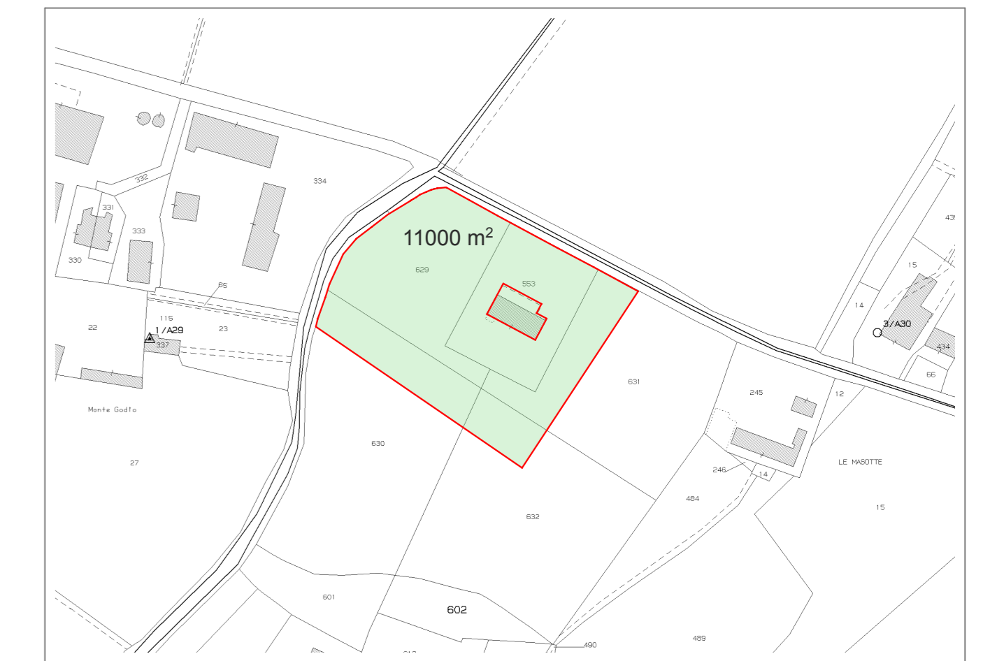
Ambito di intervento

Estratto della mappa catastale C.T. Comune di Sommacampagna Foglio 34, Mappale 553 - 629 (parte) - 630 (parte) - 631 (parte) - 632 (parte)