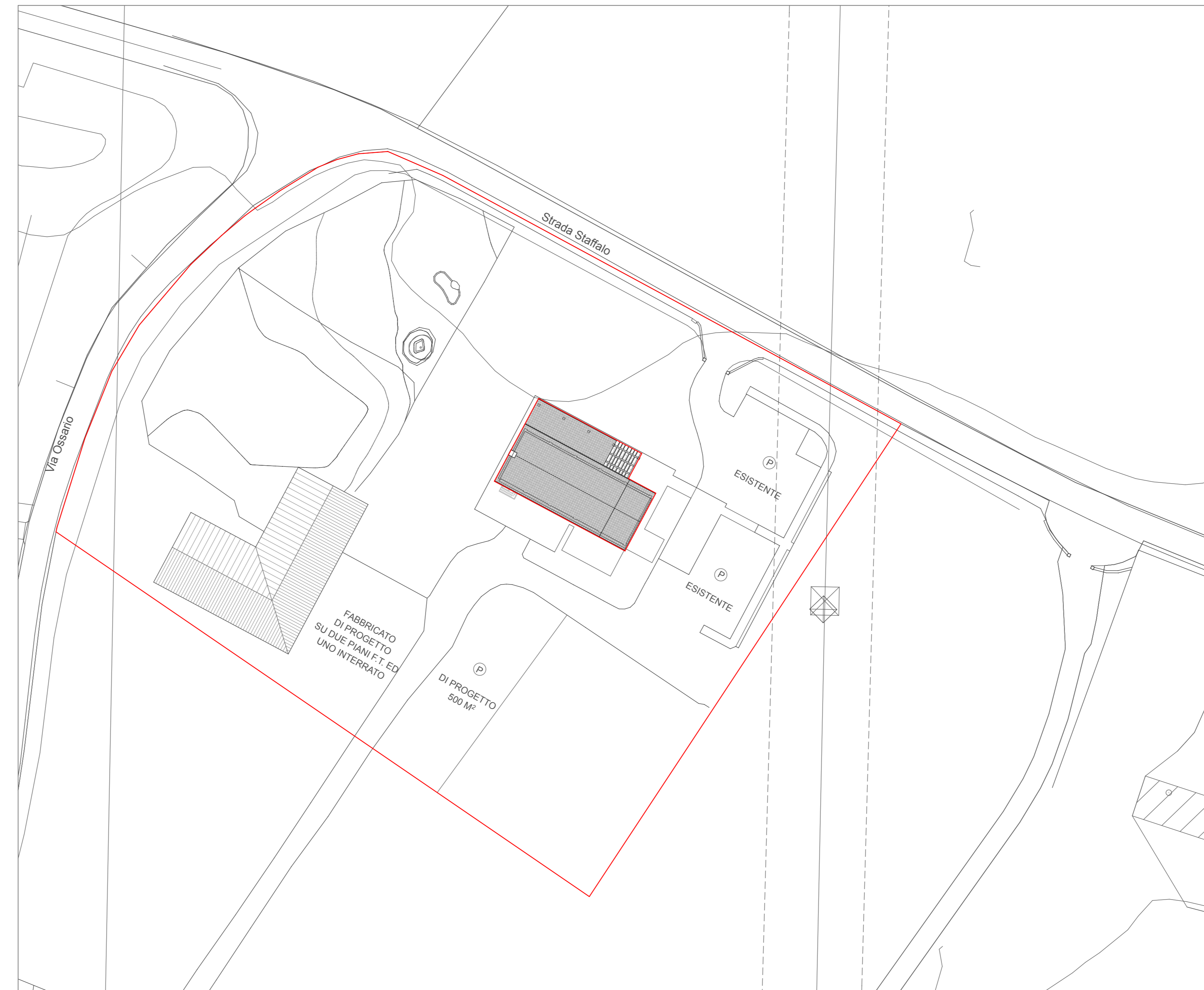
Ambito di intervento 11000 m 2