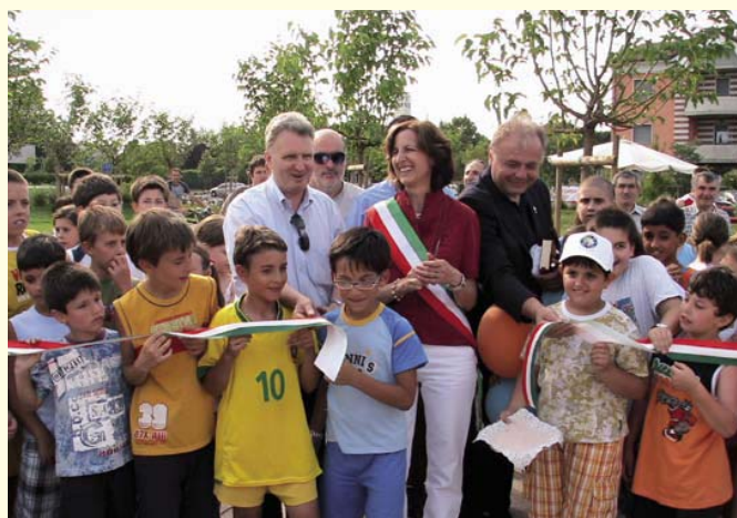
Inaugurazione di Parcobaleno a Caselle avvenuta il 30 giugno 2007