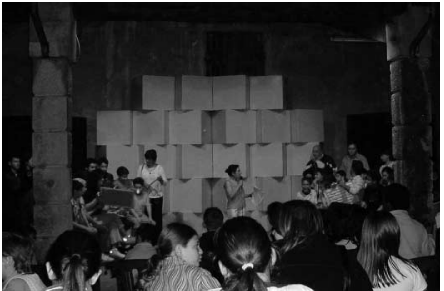
Immagine dallo spettacolo-quiz per un sorso d'acqua Villa Venier 21/05/2004.