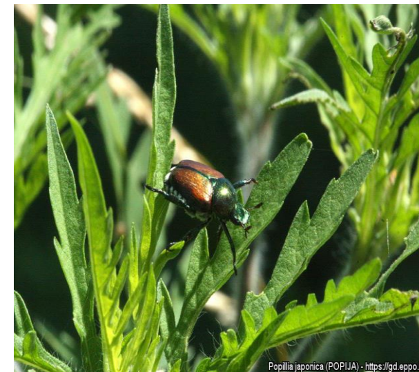
Popillia japonica (POPIJA) - https://gd.eppo.int