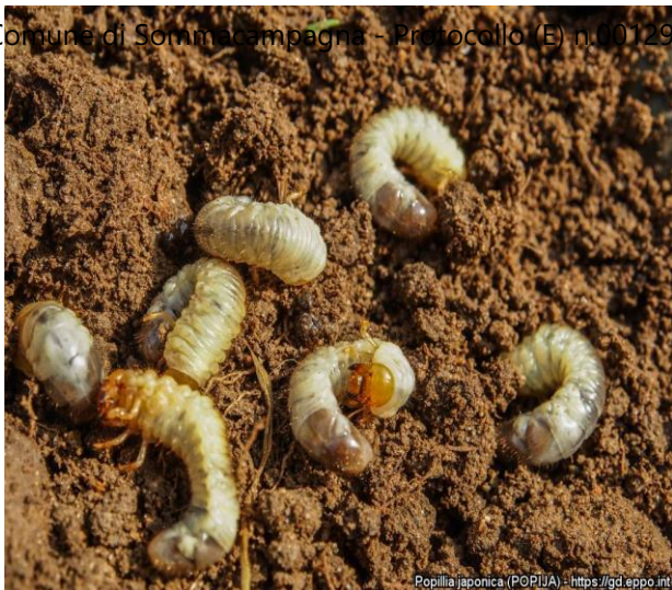
Popillia japonica (POPIJA) - https://gd.eppo.int