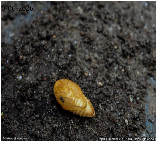
Martino Buonopane Popillia japonica (POPIJA)