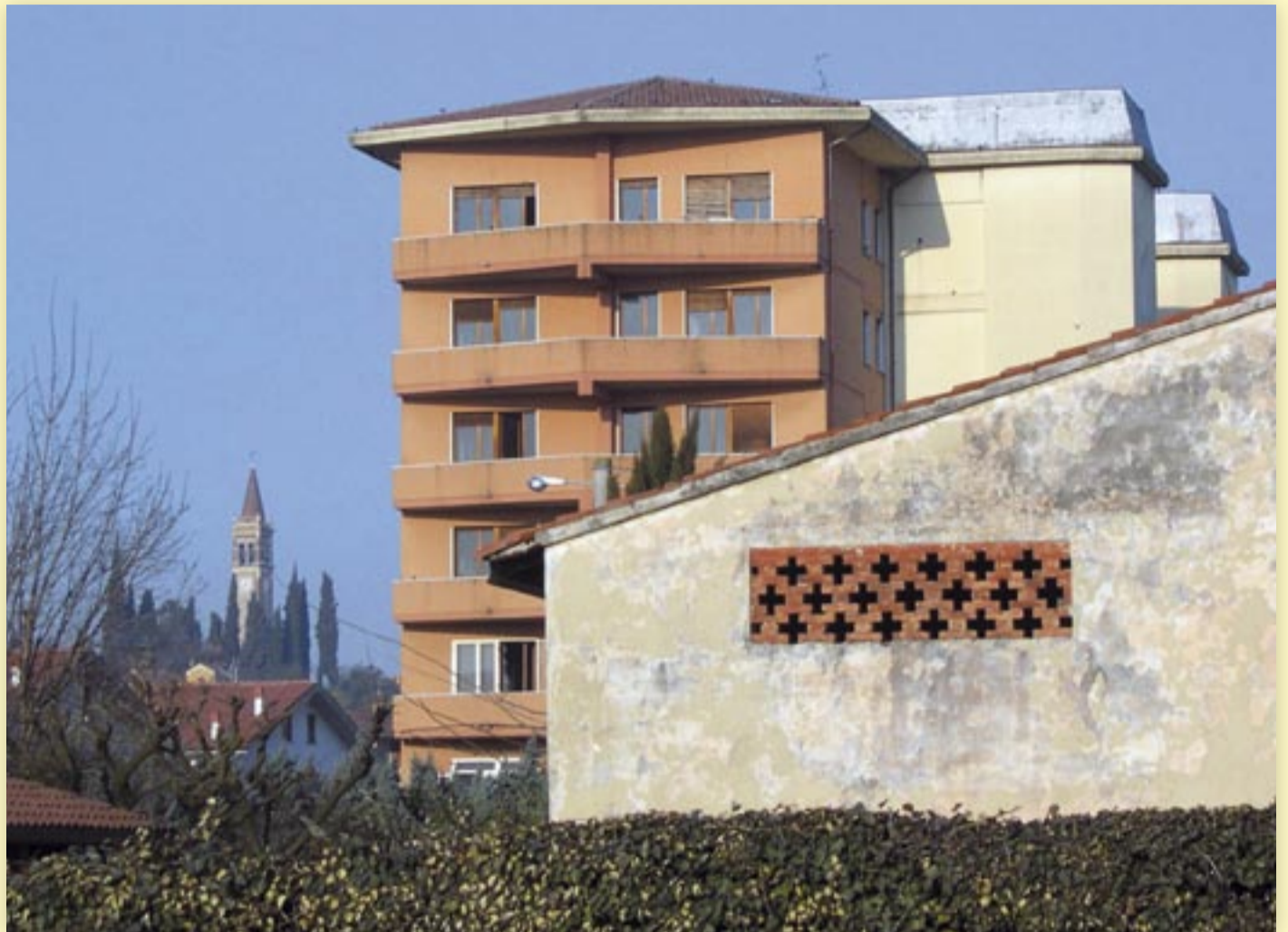
Una veduta del Palazzo ex uffici Sipa che ben coglie il forte impatto paesaggistico

del palazzone degli ex uffici SIPA - Pollo Arena da sempre motivo di disarmonia rispetto alle costruzioni limitrofe ed elemento di forte impatto rispetto alla bellezza del profilo collinare dove si erge il campanile di San Rocco, elemento caratterizzante di Sommacampagna. Nell'area saranno edificate quattro palazzine residenziali, di altezza pari alla metà dell'attuale fabbricato, e una piastra commerciale direzionale, con servizi alla persona. Anche nell'area ex Macello sorgeranno al posto degli attuali fabbricati edifici residenziali e spazi commerciali-direzionali. Così pure nell'area del capannone ex Zocca l'intervento sarà di carattere residenziale. Sono tre interventi che porteranno alla comunità un beneficio in opere pubbliche di circa 940 mila euro , in quanto le società, che opereranno i recuperi in questione, realizzeranno a loro spese migliorie delle sedi stradali, comprensive di piste pedociclabili, posti auto e verde. E' prevista anche la cessione di alloggi che il Comune destinerà all'edilizia residenziale convenzionata. Sono convinta che i Piani